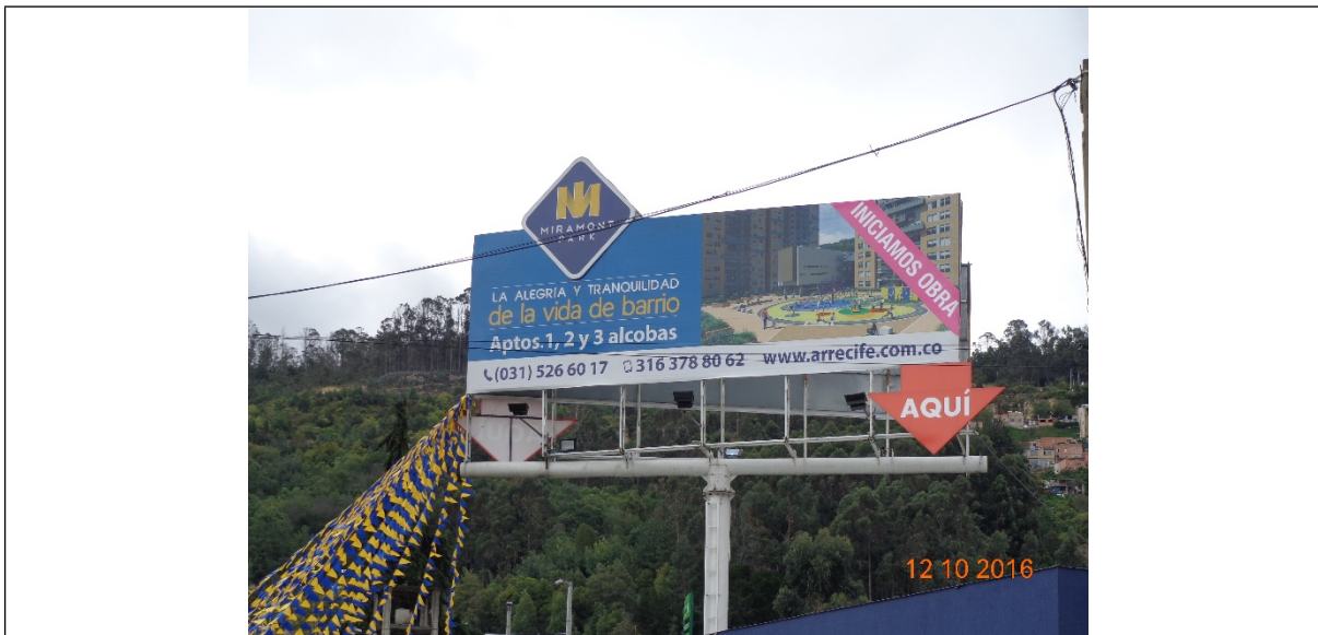
Fotografía no. 2 vista de la publicidad de la valla instalada en la Carrera 8 No. 167D - 88 sentido Oeste – Este, la cual no cuenta con Resolución de otorgamiento.