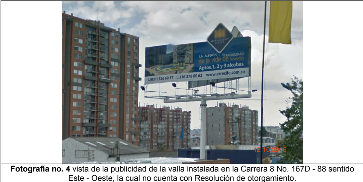
Fotografía no. 4 vista de la publicidad de la valla instalada en la Carrera 8 No. 167D - 88 sentido Este - Oeste, la cual no cuenta con Resolución de otorgamiento.